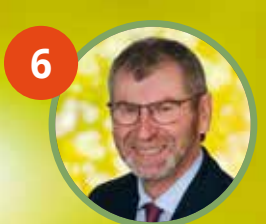
6 Günter Straußberger Rothalmünster, 1. Bürgermeister Markt Rothalmünster