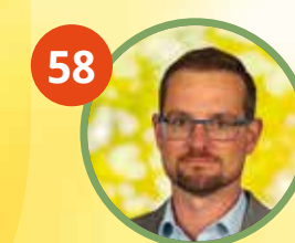
58 Johann Gerstl Vilshofen a. d. Donau - Alkofen, Landwirtschaftsmeister